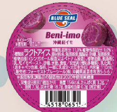
沖縄紅いも 沖縄県産の紅芋を使用。素朴でココクのある甘味が特徴