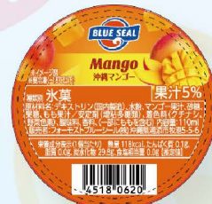
沖縄マンゴー 沖縄県産マンゴー果汁を使用した甘くてフルーティ。爽やかな酸味がおいしい