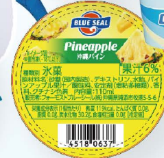
沖縄パイナップル 沖縄県産パイナップル果肉をギュッと絞ったような甘味と酸味のバランスがとってもブルーディー。