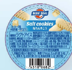
塩ちんすこう 優しい塩味の北谷の塩を使用した沖縄伝統菓子ちんすこうとバナナアイスの絶妙なバランスが人気