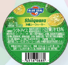
沖縄シークワサー 沖縄県産シークワサー果汁を使用した甘酸っぱさ、さわやかな柑橘の風味が楽しめます