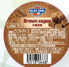
沖縄黒糖 さとうきびから作られる沖縄県産黒糖の独特な風味と上品なコク