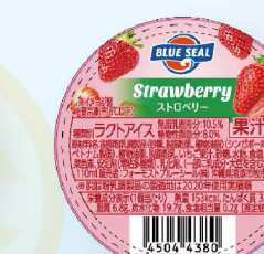
ストロベリー いちご果汁使用の甘酸っぱくさわやかな味わいが特徴