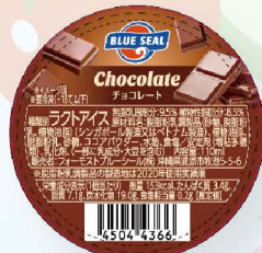
チョコレート やさしくなめらかなブルーシールのチョコアイス(は誰もが好き定番!)